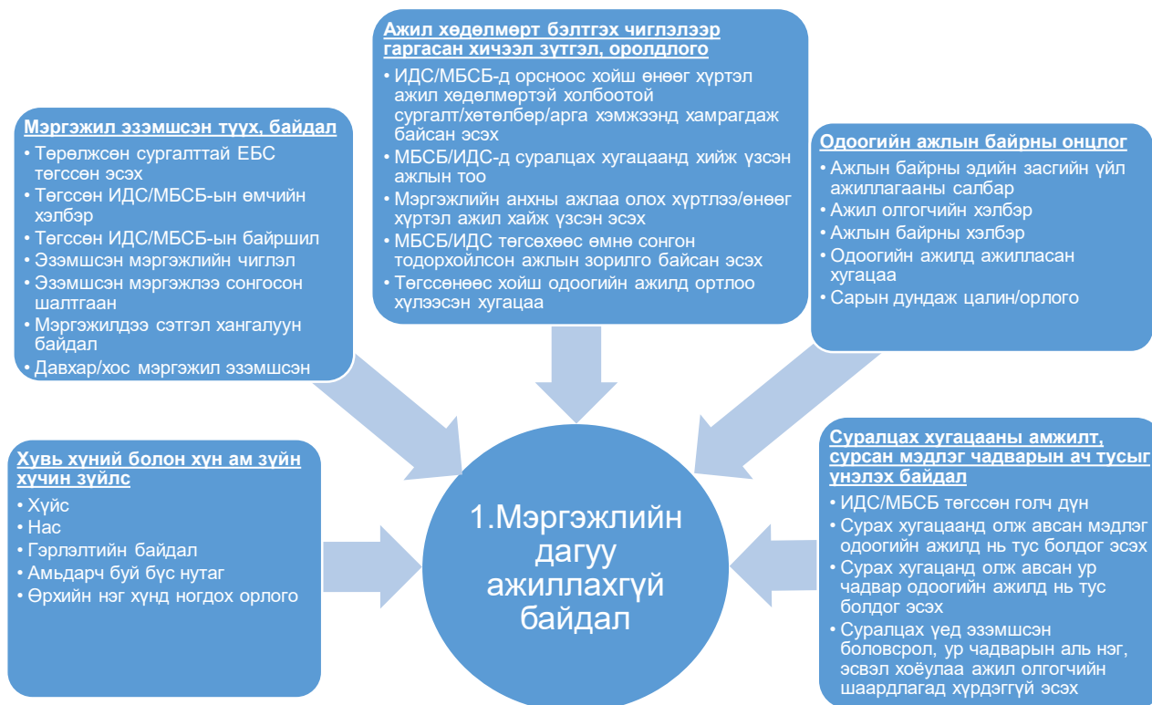
Зураг 1: Дүн шинжилгээний хүрээ

Дээрх үзэгдэлд нөлөөлж болох хүчин зүйлс буюу тайлбарлах хувьсагчдыг ерөнхийд нь 5 бүлэгт ангилан судалсан ба тэдгээрийн ерөнхий жагсаалтыг Зураг 1-д, дэлгэрэнгүй тайлбарыг Хавсралт 1-д тус тус харуулав.