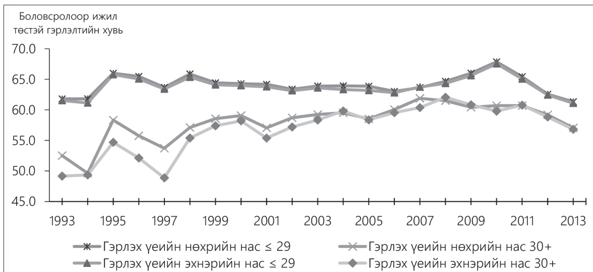
Зураг 3. Нийт гэрлэлтэд боловсролоор ижил төстэй гэрлэлтийн эзлэх хувь, гэрлэх үеийн хосуудын нас ба гэрлэсэн оноор (1993-2013)

Эх үүсвэр: МУ-ын УБЕГ-ын 1993-2013 оны гэрлэлтийн бүртгэлийн мэдээлэлд үндэслэн тооцов.