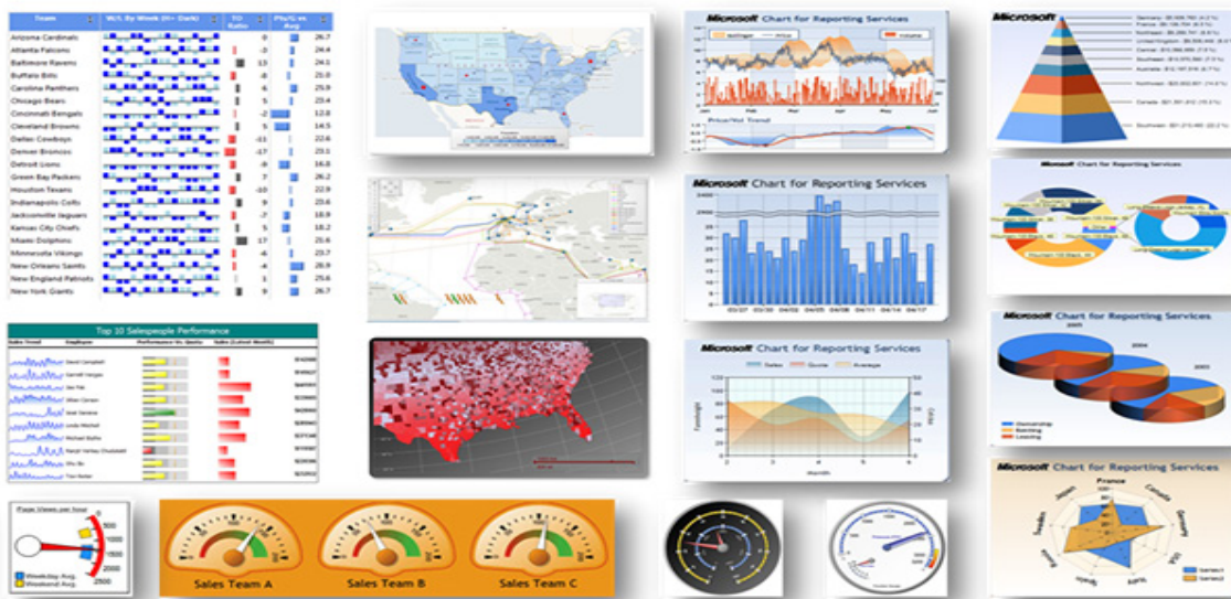
Зураг 3. Microsoft Power View программын интерактив график